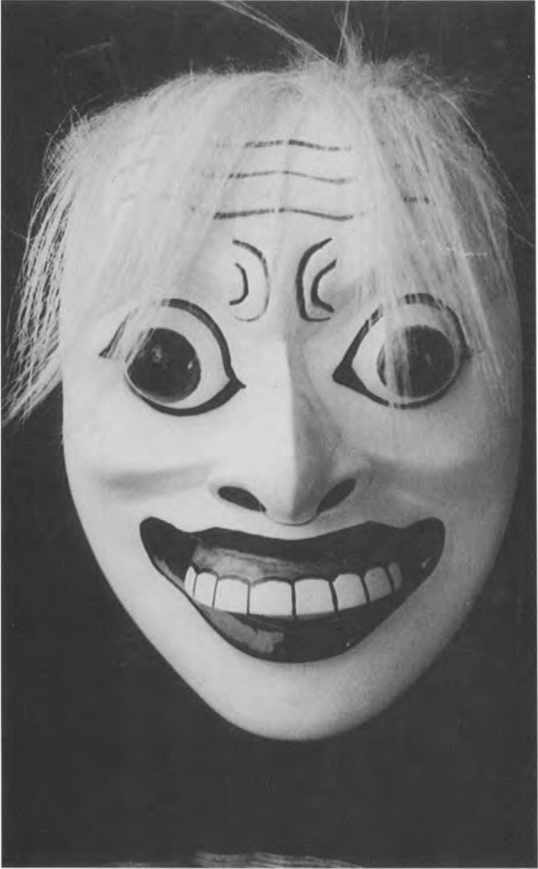
Dæmon repræsenterer det vagtsomme og fleksible