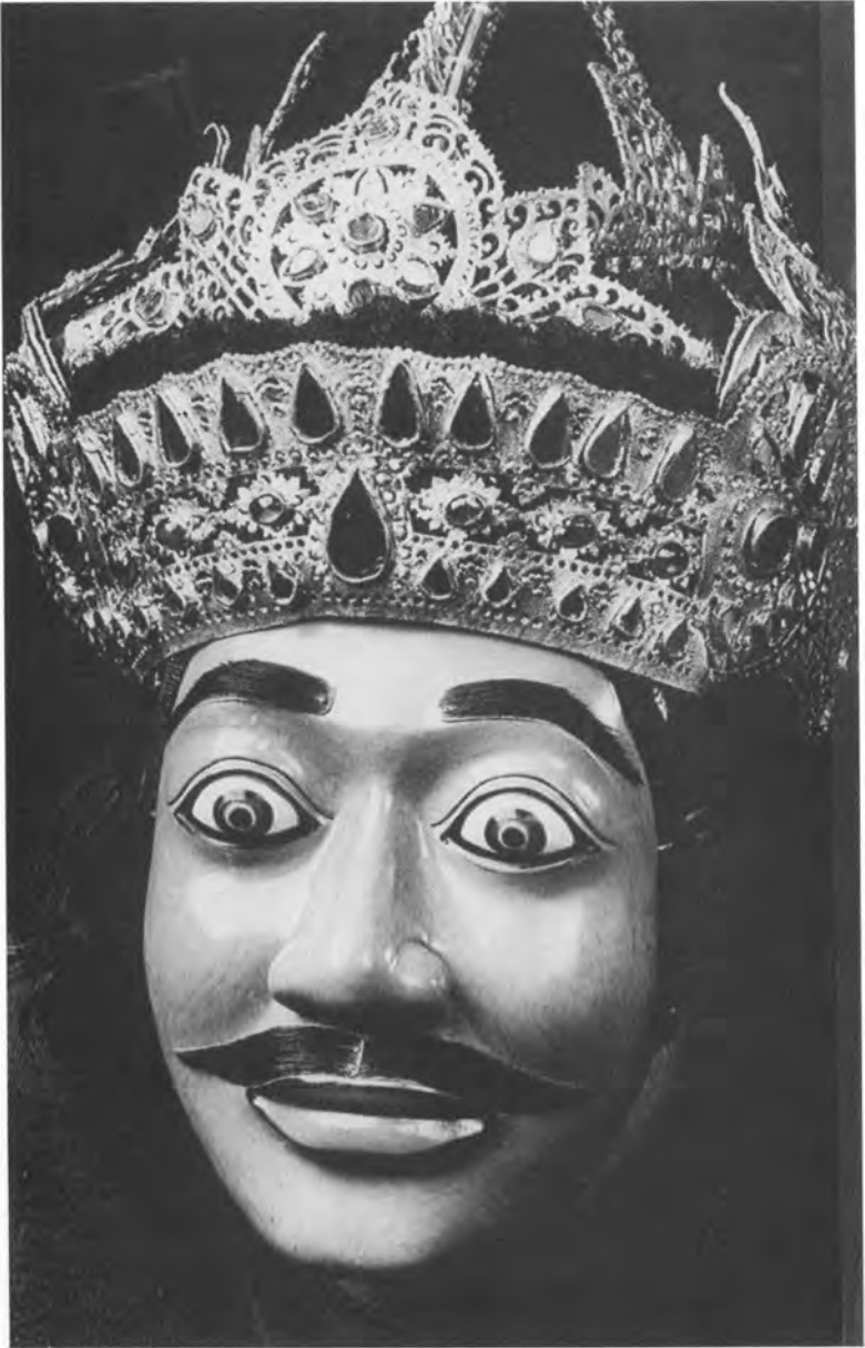
Kongens førstemand repræsenterer det handlekraftige