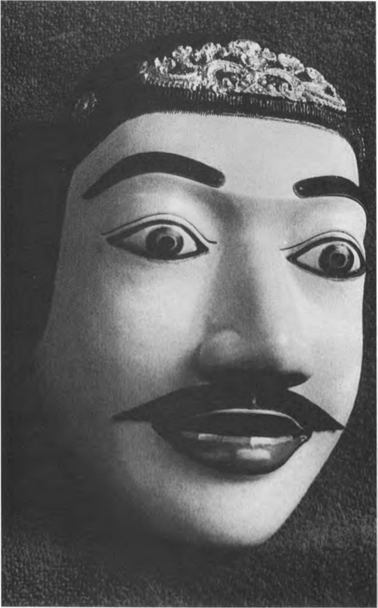
Kongen repræsenterer det ædle, forfinede og blide