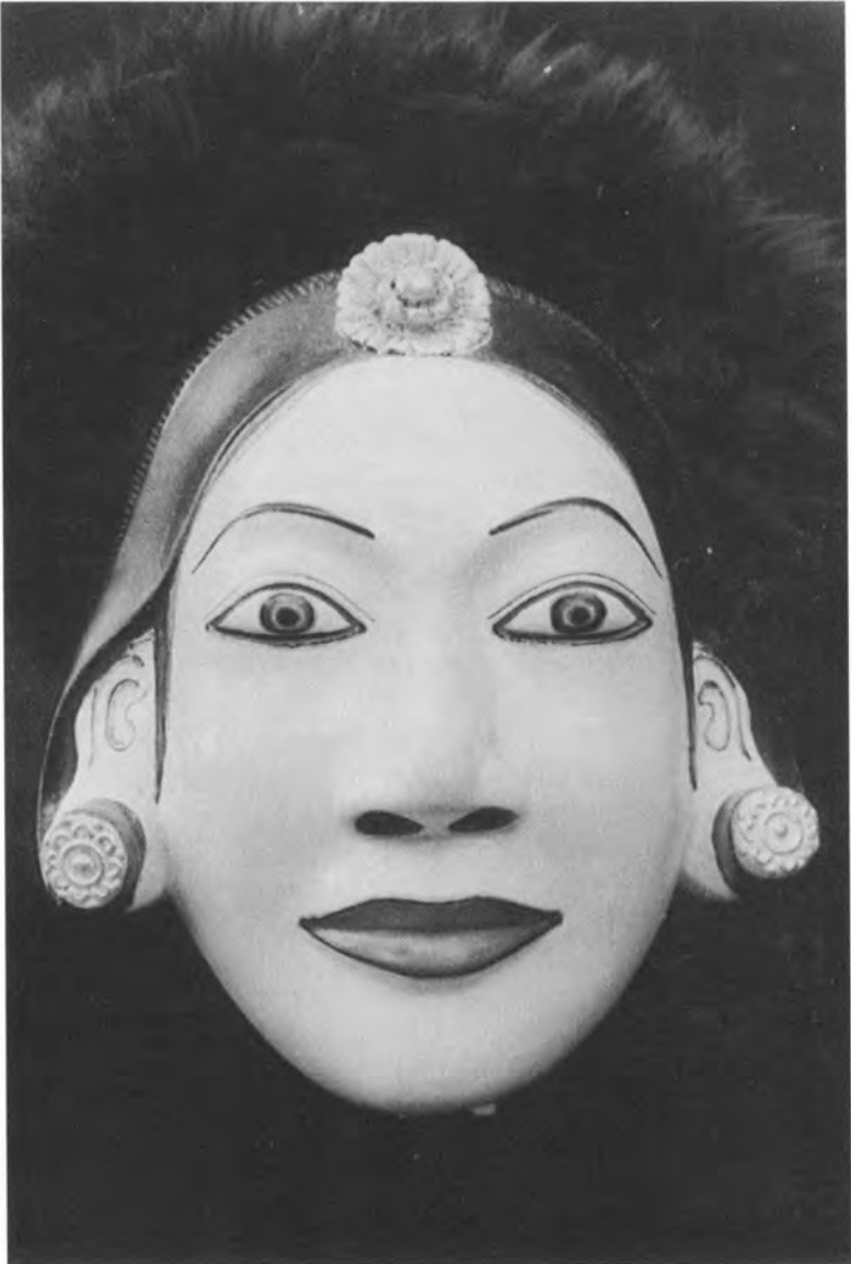
Dronningen repræsenterer det kvindelige