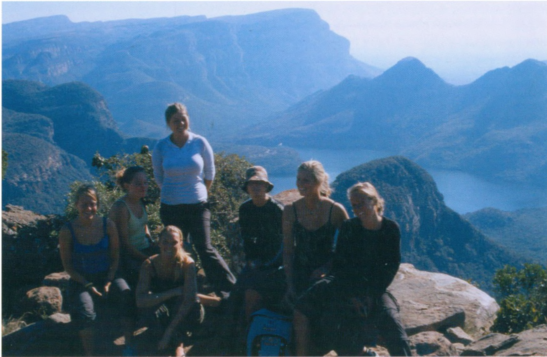
Juni 2005: Ved Blyde River Canyon