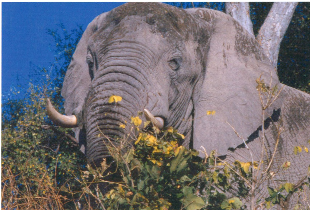
Maj 2006: Elefant på klos hold