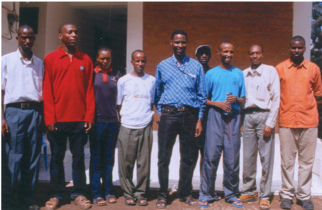
Februar 2006: Tanzanias bedste løbere før Commonwealth mesterskaberne