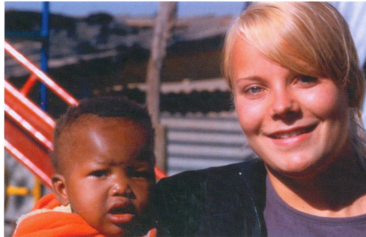
Juni 2006: Gitte i Soweto

Dette, sammenholdt med at Vejle Idrætshøjskole har en smuk og unik beliggenhed midt i Nørreskoven, tæt ved vand og strand og er let at nå med godt 2 timers kørsel, uanset hvorfra man kommer i Danmark, gør, at der også fremover kan forventes øget søgning til Kursuscenteret på Vejle Idrætshøjskole.