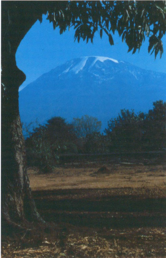
September 2004: Kilimanjaro set fra Moshi